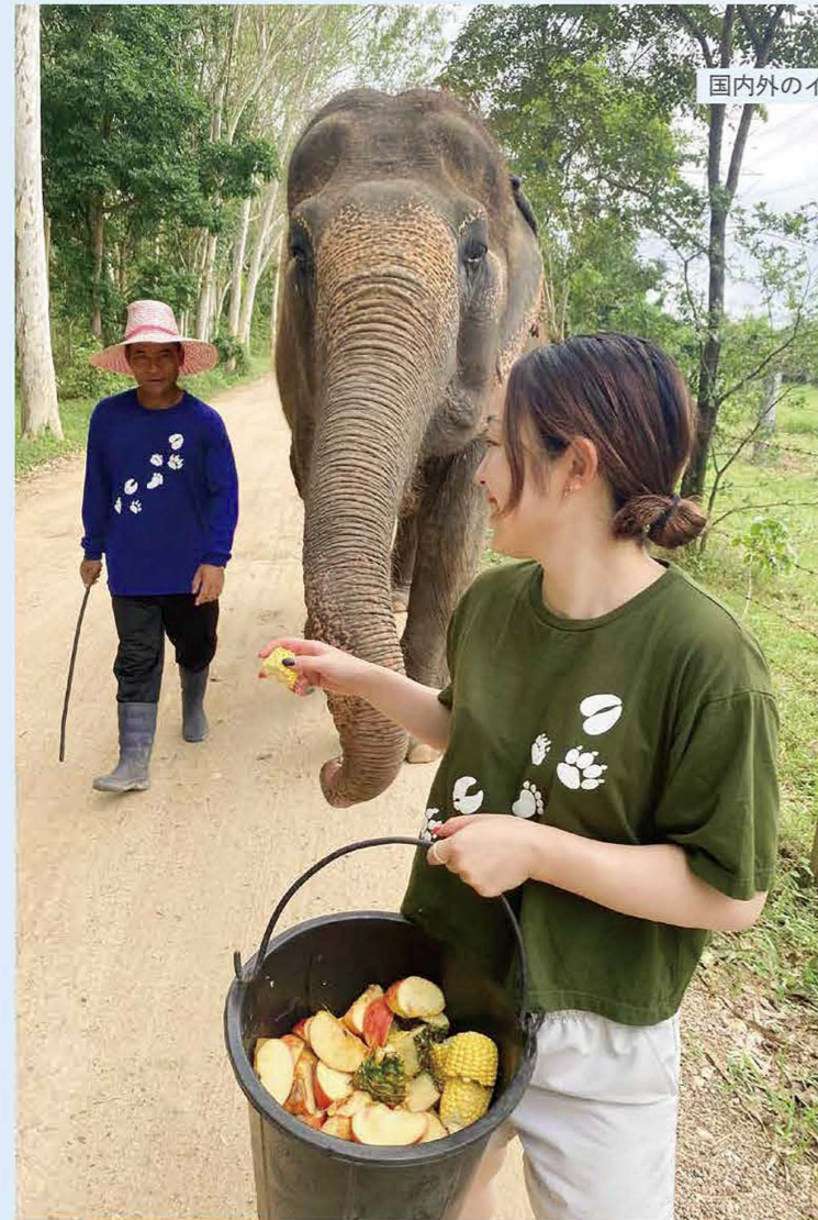
国内外のインターンシップやボランティア活動などに取り組むプログラムです。

プラットフォーム参画企業や国際機関などと連携し、国内外のインターンシップやボランティア活動などに取り組むプログラムです。今回は、国内と海外の両プログラムを経験した2名からの報告です。