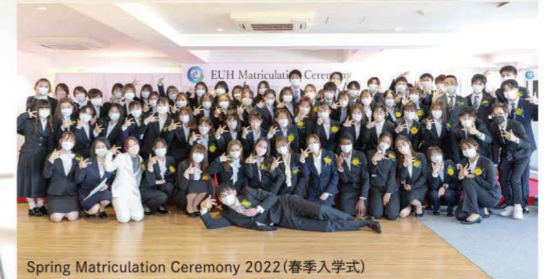
Spring Matriculation Ceremony 2022 (春季入学式)

It will soon be two full years since our university opened. Would you give us your honest impression of our campus and students.