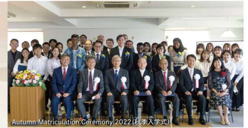
Autumn Matriculation Ceremony 2022 (秋季入学式)