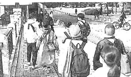
「EXPRESS HIROSHIMA」のワークショップで、広島市の平和記念公園を訪れる参加者=昨年2月

「EXPRESS HIROSHIMA」はワークショップ開催のほか、G7広島サミットや核兵器禁止条約締約国会議などに合わせてインスタグラム(@express_hiroshima)などで思いを発信している。ホームページは https://expresshiroshima7.wordpress.com/ 。